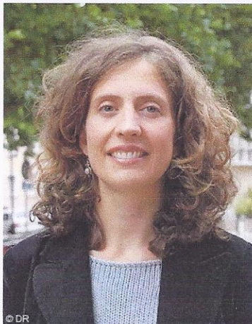
"J'enseigne l'écologie aux enfants"

SOMMAIRE DE L'ENQUÊTE "J'habite dans une yourte" "J'enseigne l'écologie aux enfants" "Je promeus les toitures végétalisées à Paris" "Je cultive un jardin partagé" "J'anime un blog vert"